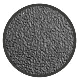
ADATTATORE FOTOINCISO [NOVATEX 7381]