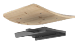
PIASTRA ADATTATORE REGOLABILE A INNESTO RAPIDO DONATI CODICE: 4515220