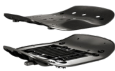
FAMIGLIA DI SEDILI FISSI O REGOLABILI A FISSAGGIO TRADIZIONALE