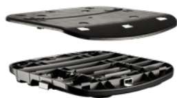
FAMIGLIA DI SEDILI REGOLABILI A INNESTO RAPIDO DONATI