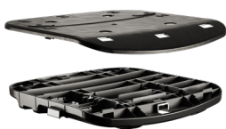
FAMIGLIA DI SEDILI REGOLABILI A INNESTO RAPIDO DONATI