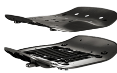
FAMIGLIA DI SEDILI FISSI O REGOLABILI A FISSAGGIO TRADIZIONALE