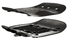
FAMIGLIA DI SEDILI FISSI O REGOLABILI A FISSAGGIO TRADIZIONALE