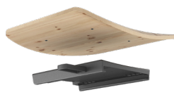
PIASTRA ADATTATORE REGOLABILE A INNESTO RAPIDO DONATI CODICE: 4515220