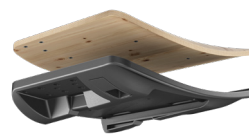
MODULA 1 ADATTATORE REGOLABILE A INNESTO RAPIDO DONATI CODICE: 4515270