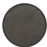
COPERTINA PER IMBOTTITO IN PLASTICA NERA