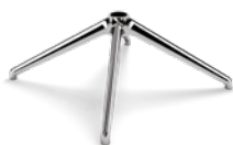
BASE SUPERLEGGERA 4 RAZZE - MEDIA CONO MORSE ∅ 50 mm CODICE: 5010460