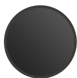
PISTONE IN ACCIAIO VERNICIATO NERO