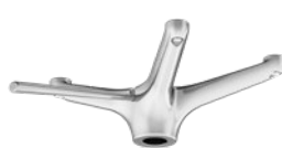
SUPERLEGGERO GIREVOLE CON COMANDO GAS CODICE: 1050620