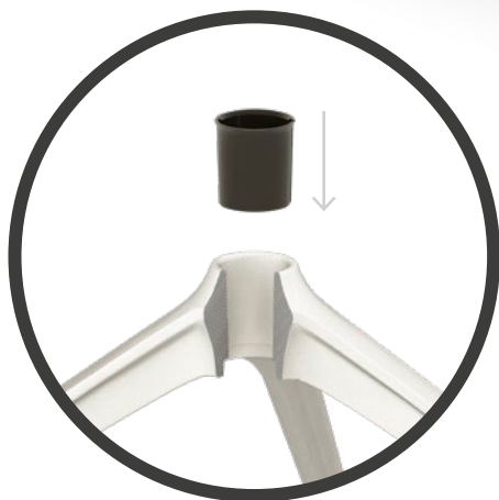
BOCCOLA ADATTATORE DISPONIBILE IN DUE DIMENSIONI DI DIAMETRO ESTERNO