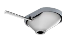
COLLEZIONE ARMONICO CON COMANDO GAS