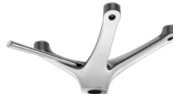
SPIDER GIREVOLE CON COMANDO GAS CODICE: 1050530