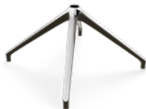
BASE UNICA 4 RAZZE CONO MORSE Ø 44 mm CODICE: SU RICHIESTA