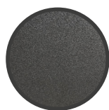
VOLANTINO IN PLASTICA NERA