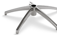
METEORA (ALLUMINIO) CODICE: 5010146