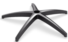
DB2.6 (NYLON) CODICE: 5012015