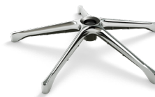
DB2.13 (ALLUMINIO) CODICE: 5010715