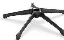
DB2.13 (NYLON) CODICE: 5012040