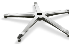
DB1.9 (ALLUMINIO) CODICE: 5010290