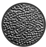
FOTOINCISIONE (NOVATEX 716)