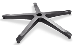
DB1.9 (NYLON) CODICE: 5012035