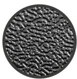
FOTOINCISIONE (NOVATEX 136)