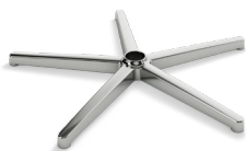
DB1.8 (ALLUMINIO) CODICE: 5010280