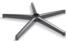
DB1.8 (NYLON) CODICE: 5012030