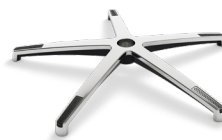
DB1.6 (ALLUMINIO) CODICE: 5010247