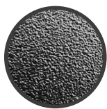
INSERTI: FOTOINCISIONE [NOVATEX 016]