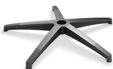
DB1.6 (NYLON) CODICE: 5012007