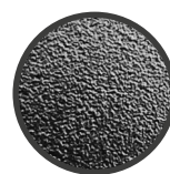
INSERTI: FOTOINCISIONE (NOVATEX 016)