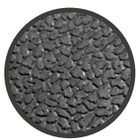
FOTOINCISIONE (NOVATEX 140)