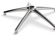
B1T (ALLUMINIO) CODICE: 5010260