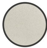
BRACCIOLO IN NYLON RAL 9002