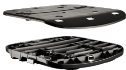
FAMIGLIA DI SEDILI INNESTO RAPIDO DONATI TRASLA 2 / TRASLA 2 CABLE