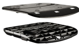
SEDILE INNESTO RAPIDO DONATI TRASLA 3